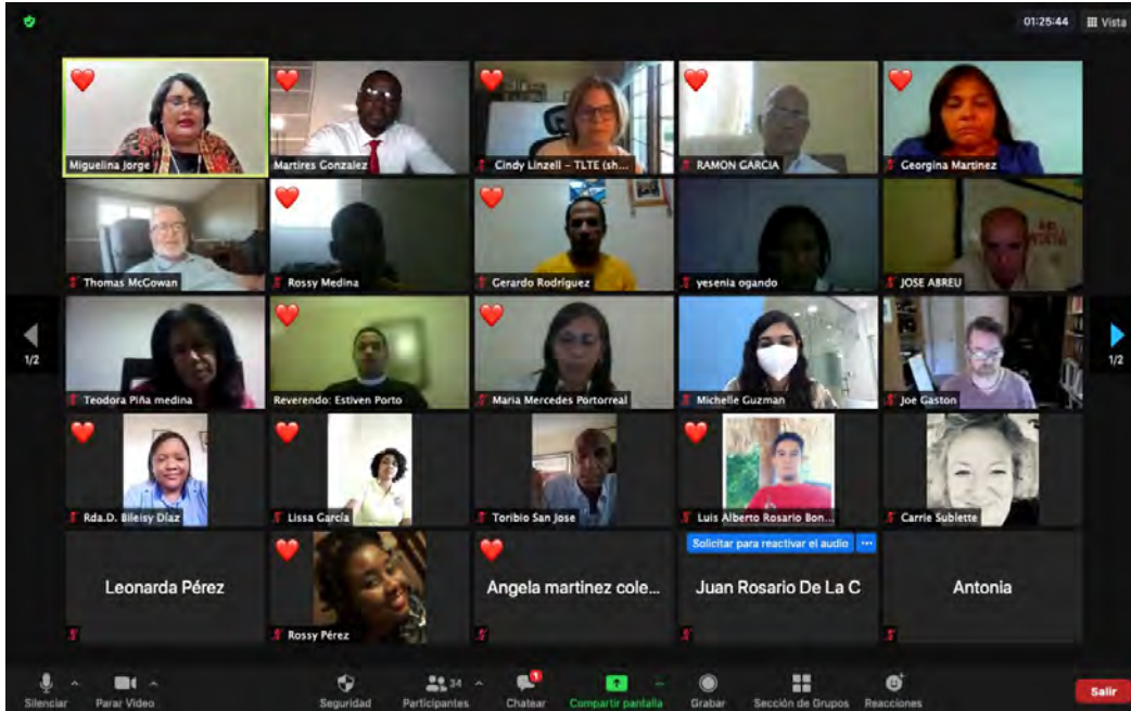
Los participantes se saludan unos a otros con un corazón simbolizando el cariño y la alegría de reunirse una vez más. | Participants salute each other with a heart symbolizing caring and joy at meeting once again.