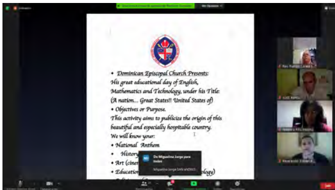
Nuestras conversaciones produjeron un plan para las actividades del verano, con los objetivos que los estudiantes deben alcanzar en sus presentaciones.