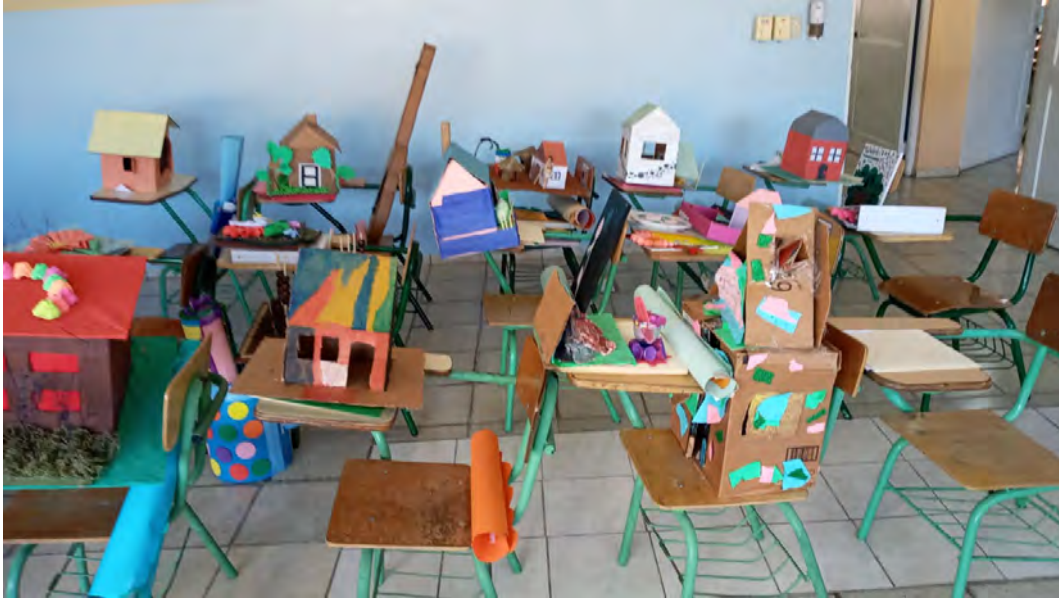
Los estudiantes presentan su trabajo para sus padres.