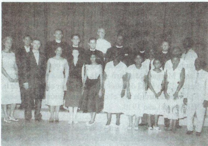
Primera Convención Diocesana 1959.