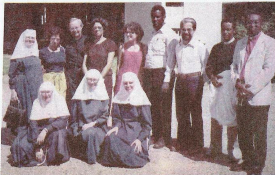
Hermanas de la Transfiguración en reunión Santo Domingo, 1979.