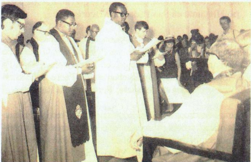
Consagración como Obispo Telesforo Isaac, 1972