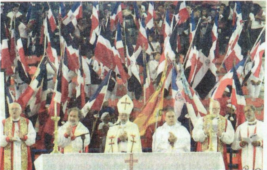
Eucaristía de clausura Primer Encuentro en Misión Abril, 12-14 2013.