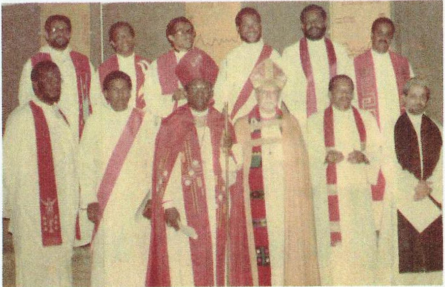
Ordenación Diaconal en San Andrés, 11 Julio 1976.