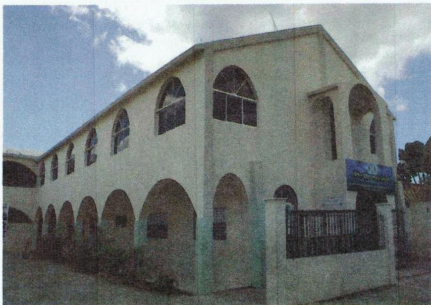
Clínica Esperanza y Caridad, San Pedro de Macorís.