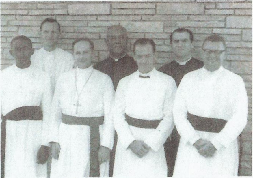
Clero Diocesano junto al Obispo Kellogg 1960.