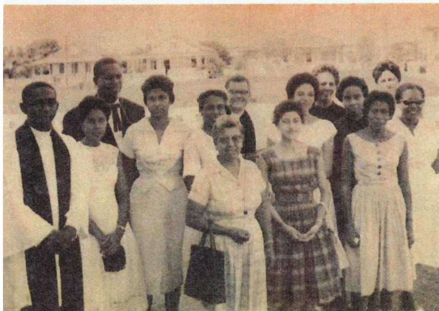
Mujeres Episcopales Santa Margarita, 1960.